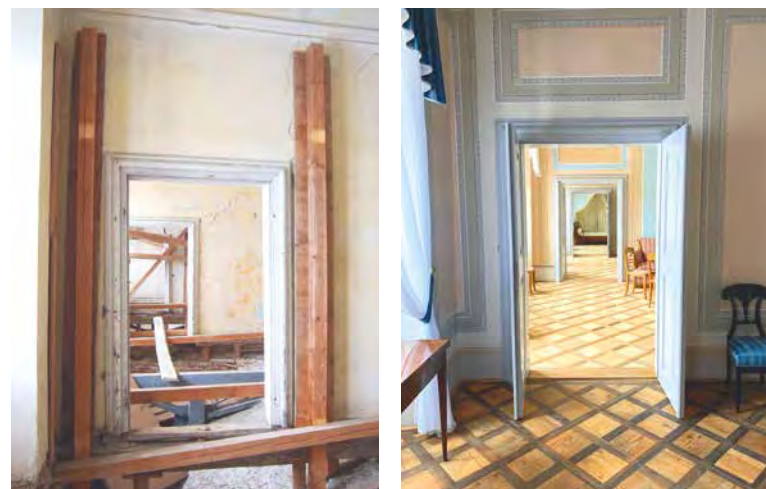
Proměnu severního zámeckého křídla dokumentuje série srovnávacích fotografií před a po rekonstrukci.