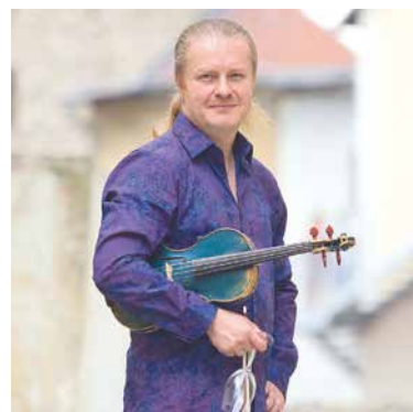
☞ Dlouholetým patronem Hudebního festivalu Znojmo je houslový virtuóza Pavel Šporcl.