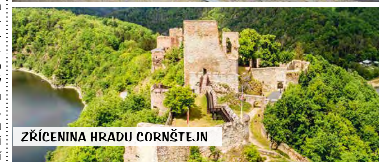
ZŘÍCENINA HRADU CORNŠTEJN