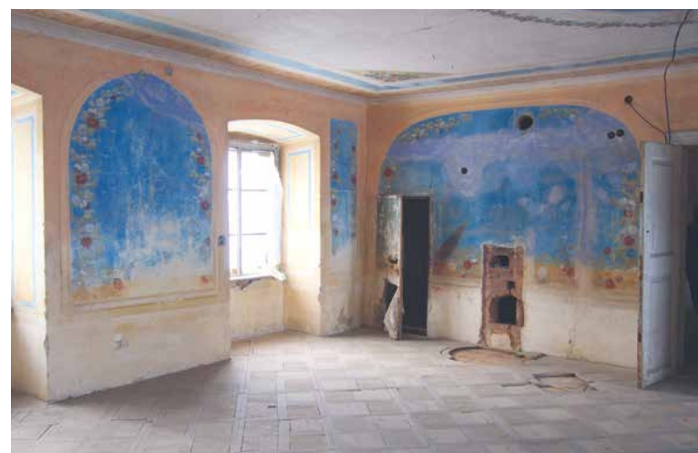
Původní stav Květinového salónku a stav po rekonstrukci, díky které opět rozkvetl.