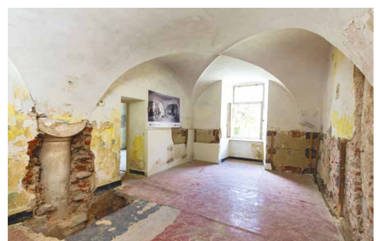
Během rekonstrukce byly objeveny původní architektonické prvky, které dnes působivě obohacují interiér nového Centra Louka.