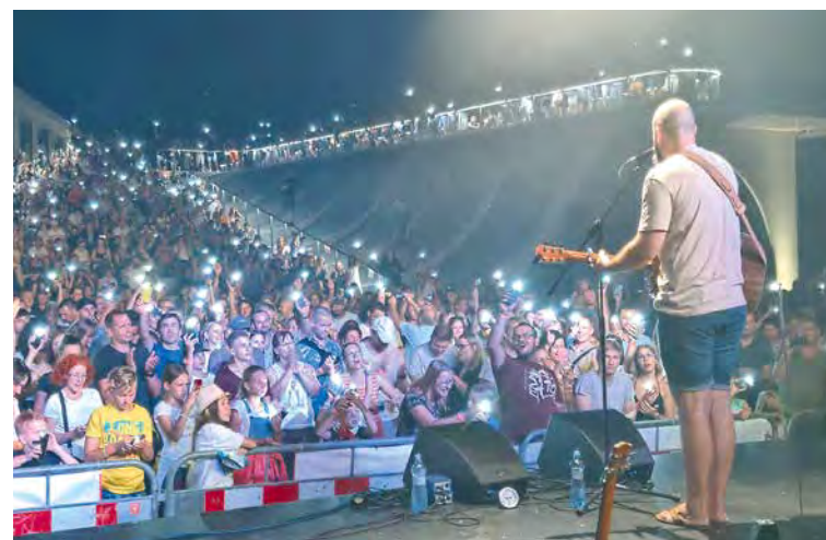
☞ Festival Hudba na vinicích každoročně propojuje hudební a vinařské špičky České republiky.