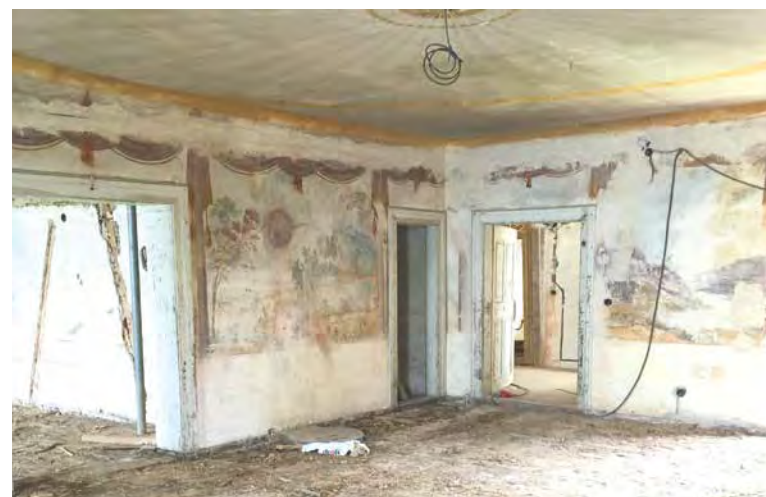
Velmi poničená výmalba zámeckého pokoje, která po zásahu restaurátorů už opět navozuje iluzi výhledu do krajiny z tureckého stanu.