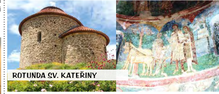
ROTUNDA SV. KATEŘINY