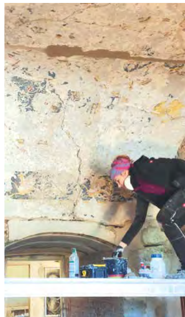
➤ Během restaurátorských prací byly na stropěch pod zámeckou věží objeveny a zachráněny mimořádně cenné renesanční malby.

Zámek v Moravském Krumlově se po několika hořkých desetiletích stal příjemným a důstojným místem jak pro umělecké výstavy uvnitř objektu, tak pro akce a festivaly nejrůznějších žánrů na prostorném nádvoří