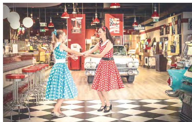
➤ Muzeum Terra Technica představuje nejen historii hudby a zábavy, ale i nalesněné veterány, hvězdy stříbrného plátna či superhrdinu.

Staré technické památky učarovaly už nejednomu člověku a zdaleka nejde jen o mužskou populaci. Vydejte se s námi na místa, která jsou technice přímo zasvěcená – překvapí vás, kolik jich je na Znojemsku veřejnosti přístupných.