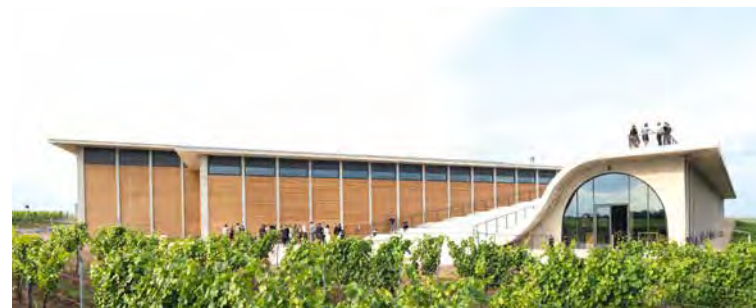
☞ Obří vlna Vinařství LAHOFER uprostřed vinic s vyhlídkovou střechou a amfiteátrm upoutává pozornost ve dne i po setmění.