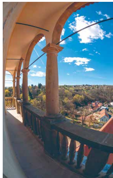
➤ Zámecká věž letos poprvé nabídne jedinečný výhled do kraje.

Další rekonstrukce historické památky se v posledních 3 letech odehrává v Moravském Krumlově. Zdejší renesanční zámek zdobí cenné arkády na obou vnitřních nádvořích, dokonce ve třech patrech nad sebou, a unikátem je také arkádové koňské schodiště. V 16. století byl pány z Lipé přebudován z původního středověkého hradu vystavěného v nejužším místě meandru řeky Rokytne. Poslední úpravy pak byly provedeny v 18. století Liechtensteiny, kteří byli nejvýznamnějšími šlechtickými majiteli panství po tři staletí.