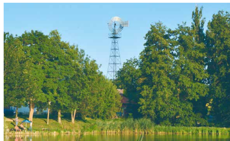
➤ Větrné lopatkové kolo ve Vedrovicích.

Zajímavou technickou památkou jsou dochovaná lopatková větrná kola. Ve Vedrovicích se zachovalo v kompletním stavu z roku 1912 jako jediné na jižní Moravě a je zapsáno na seznam nemovitých kulturních památek. Bylo určeno k čerpání vody do vodojemu a jejího rozvodu po vsi. Na stožáru nad obcí je dnes umístěna odlehčená, ale plně funkční replika. Původní větrná turbína zdobí dvůr