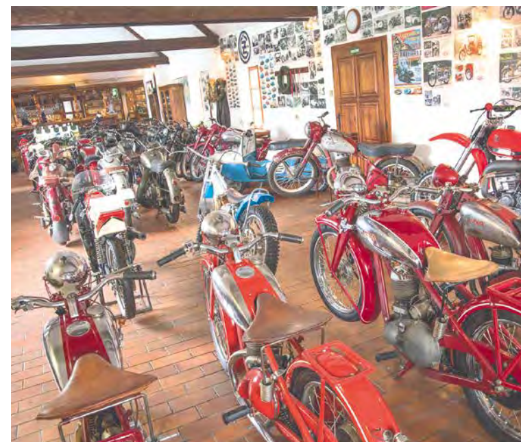
➤ Veteransalon v Lesné u Znojma.

Ve správě Technického muzea v Brně je (mimo jiné) národní kulturní památka, rene-