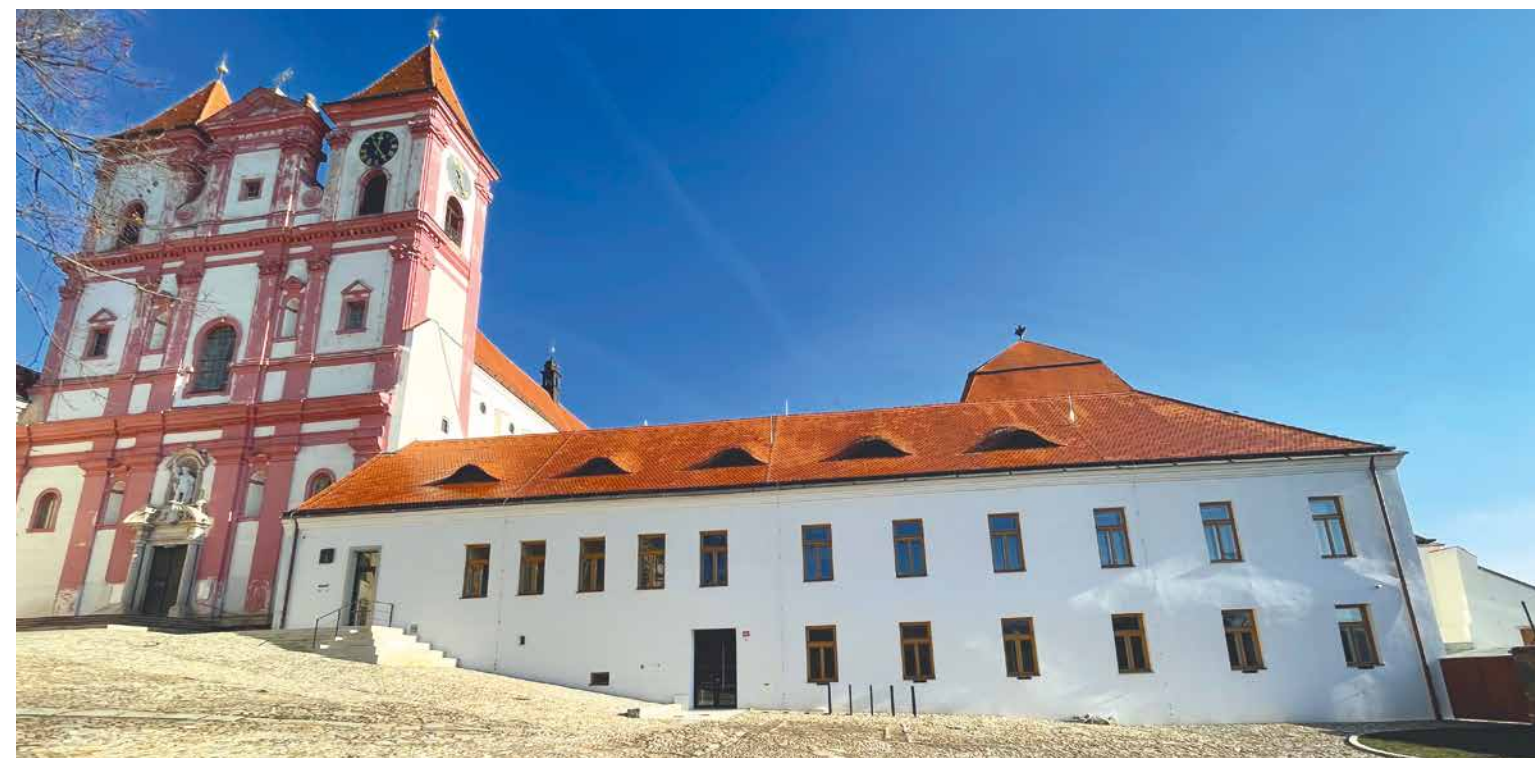
Centrum Louka vzniklo citlivou rekonstrukcí budovy tzv. staré školy v areálu znojemského Louckého kláštera.