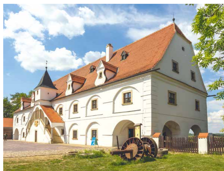
➤ Vodní mlýn ve Slupi.

veteránů, filmových hvězd, komiksových superhrdinů či videoher. Exponátů je zde více než 2000 a naprostá většina z nich je plně funkčních. Cesta časem tu začíná rokem 1880 a k vidění je např. i originální Batmanův Batmobil nebo limuzína Chrysler, kterou vlastnil Stan Laurel – ten stihlejší z populární dvojice komiků Laurel & Hardy. Nechybí zde ani stylově zařízená kavárna a obchod pro fanoušky. Další zábavní přístroje, určené pro změnu těm nejmenším,