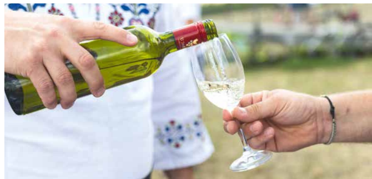
☞ Ochutnávky vybraných vín doprovázejí každý z koncertů Hudebního festivalu Znojmo.