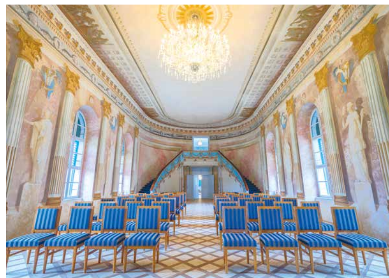
Banketní sál zámku Uherčice opět hostí reprezentativní kulturní akce.