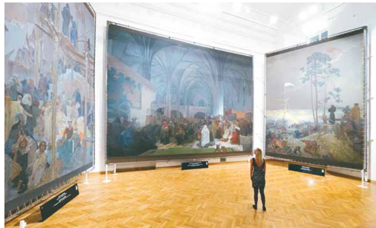
➤ Zámek v Moravském Krumlově opět hostí slavnou Slovanskou epopej malíře Alfonse Muchy.

Těmi posledními byli Kinští, kterým však byl v roce 1945 zámek znárodněn. Za 2. světové války bylo město těžce poničeno bombardováním, a tak byly na zámek nouzově umístěny úřady a byty. Užívala jej pak i armáda, výrobní podnik, byl zde také železniční internát, učebny a učňovské dílny. Tento stav, který historické hodnotě zámku příliš neprospěval, trval do roku 1991. Rok na to jej za symbolickou 1 korunu získala akciová společnost Zámek, která však nedokončila ani stavebně historický průzkum, zámek