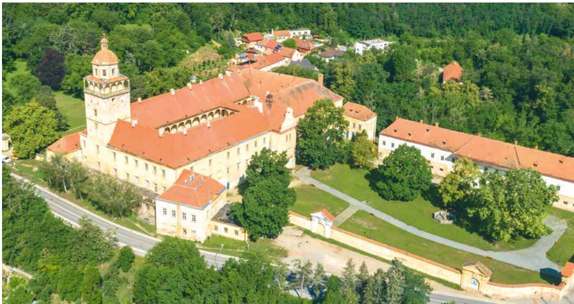
➤ Rekonstrukce se v Moravském Krumlově dočkalo celé jižní zámecké křídlo i s dominantní věží.