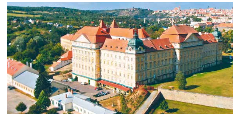
Stará škola je součástí areálu barokního Louckého kláštera na jižním předměstí Znojma.

www.znojemskabeseda.cz www.znovin.cz/loucky-klaster-ve-znojme