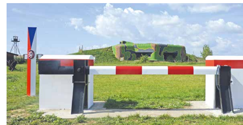
➤ Areál čs. opevnění a železné opony v Šatově.

probíhají prohlídky s průvodcem od dubna do října. Ve vybrané dny jsou přístupné i další pevnosti, např. pěchotní sruby MJ-S 4 „Zatáčka“ ve Chvalovicích a MJ-S 15 „Závora“ v Dyjkovicích , dále Pevnostní muzeum Vranov nad Dyjí s bunkrem „Studánka“ a malou naučnou stezkou, Muzeum čs. opevnění 1938 ve Slupi anebo Minimuzeum čs. opevnění 1935–1938 u Moravského Krumlova . znojmoregion.cz/turisticky-cil/36/vojenske-pamatky