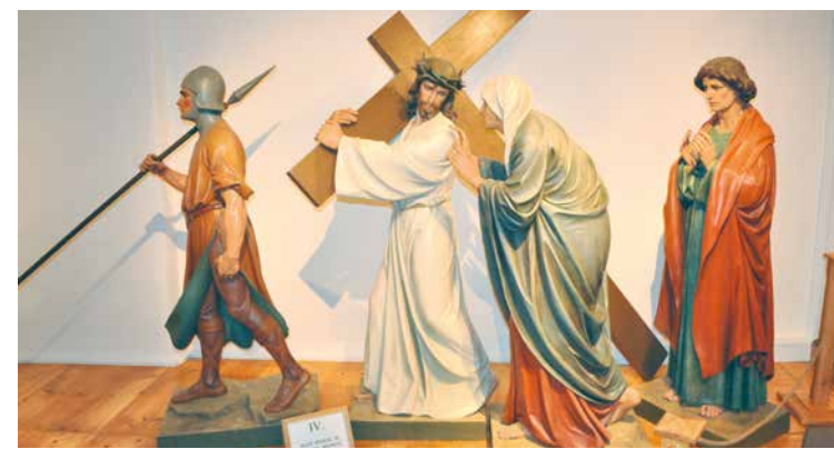
Expozice křížové cesty v Bohuticích.

Patříte-li k milovníkům umění či církevních památek, oceníte unikátní soubor 54 vyřezávaných soch zpodobňujících poslední cestu Ježíše Krista. Je k vidění na malém renesančním záměčku v Bohuticích nedaleko Moravského Krumlova. Sochy v životní velikosti ohromují svým mimořádným uměleckořemeslným zpracováním i expresivní mimikou a gestikou. Sousedí s místním turistickým infocentrem. http://krizovacestabohutice.cz